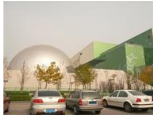
2010年完成 中国科学技術館(新館)

(株)五藤光学研究所は光学式プラネタリウム+大型映像(IMAXが受注)+デジタルが三位一体となった最新システムを実現しました。この三位一体システムは未だ世界に納入実績がなく、世界初の画期的システムです。プラネタリウムのドーム直径は30m、収容人員は500人以上。共に世界最大級です。